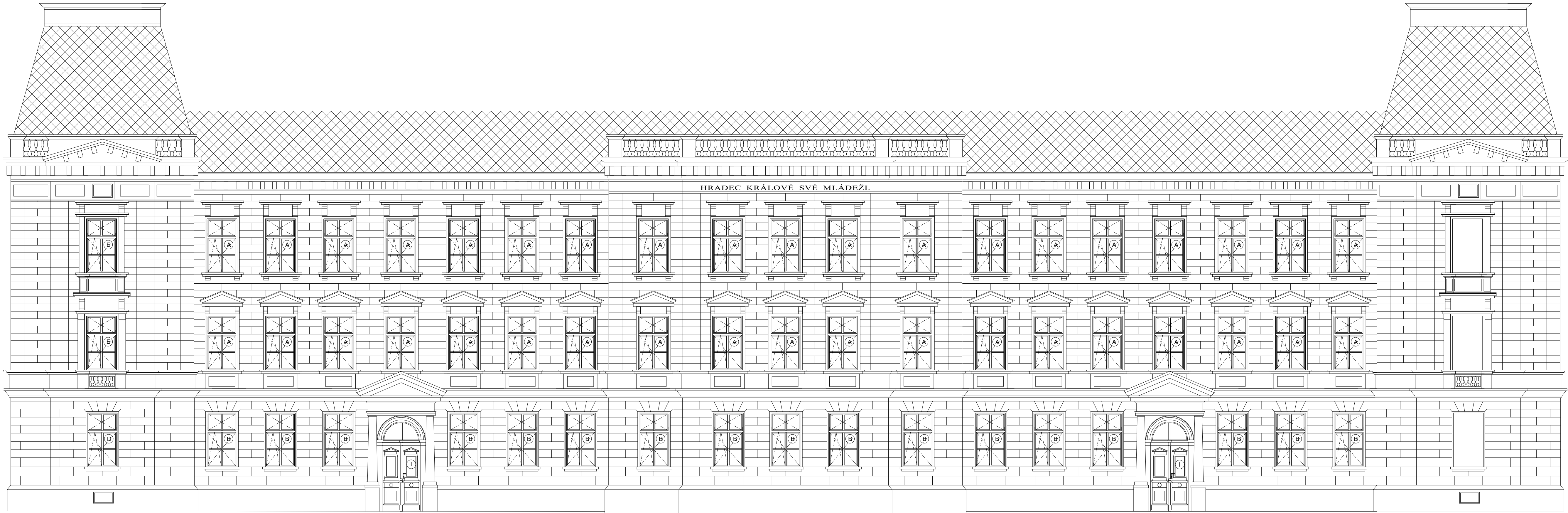
I. ETAPA / FASÁDA 2